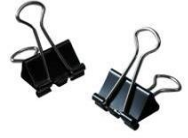
・ダブルクリップ