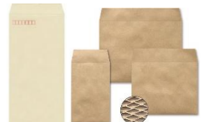
・封筒/クッション封筒