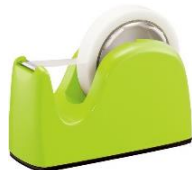
・テープカッター