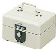
・印箱(木製を除く)