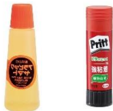
・のり(液状・固形)