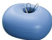
・クリップケース