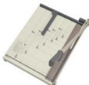
・直刃式紙裁断機 (別称:ペーパーカッター)