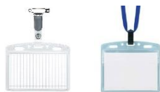
・名札 (衣服取付型・首下げ型)