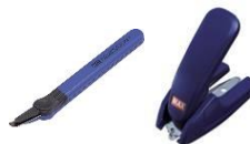
・ステープラー針 リムーバー