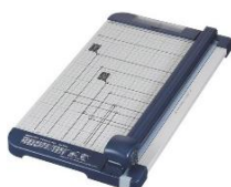
・丸刃式紙裁断機